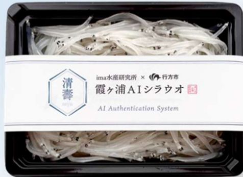
200gでの販売パッケージ