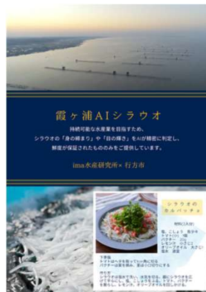
試食会等イベント