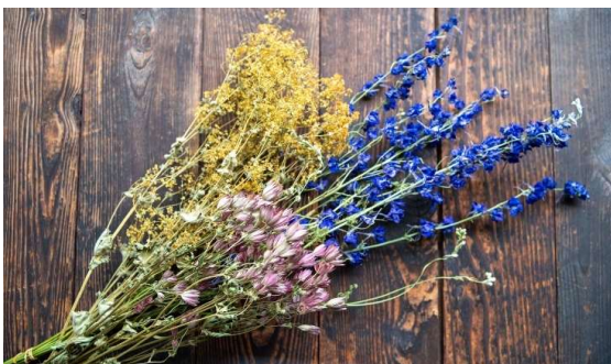
商品名「KUNI FLOWERS」として商品化