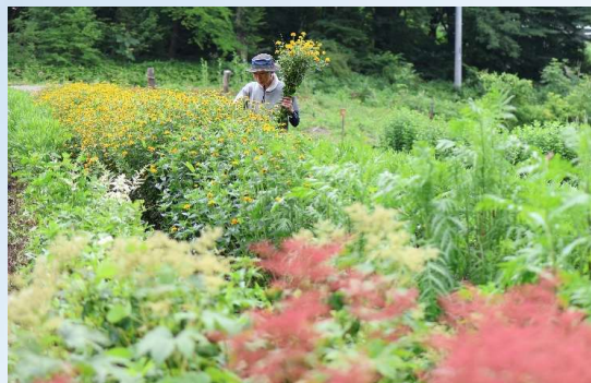
年間約100種類の切り花を生産