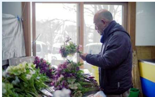
農家から生花を買取り、 ナチュラルドライ法で加工