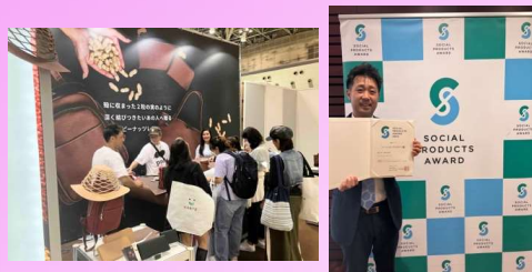
東京ビッグサイト展示会&ソーシャル プロダクツアワード受賞