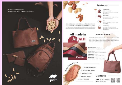
ピーナッツレザーチャリ