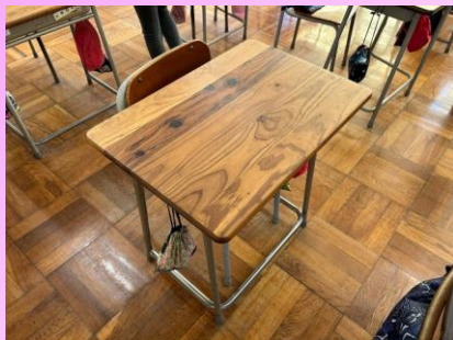
地域スギを圧縮して作った 小学校児童机天板