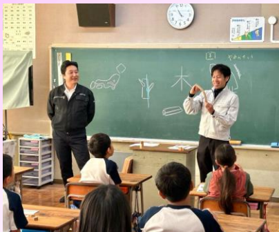
机を収めた教室での木育授業風景