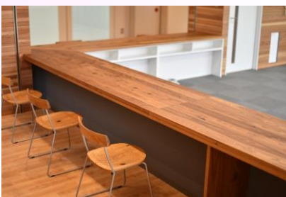
市民局窓口カウンター天板・イス