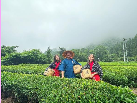
外国から茶摘み参加