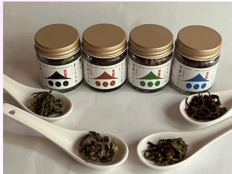
食べるお茶・発酵ほろに® 4フレーバー商品