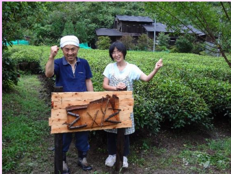
企業サポーター シグマクシスの看板