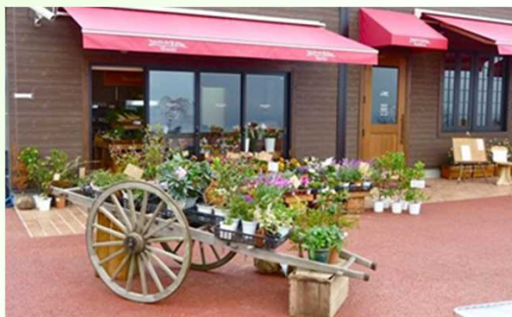
マルシェ（農産品直売所）の外観