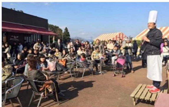
春・秋に実施する交流イベント