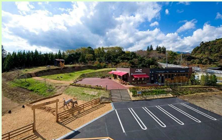
一夜城ヨロイツカファームの全景