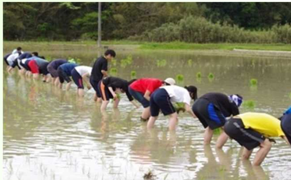
遊休農地での田植えの様子