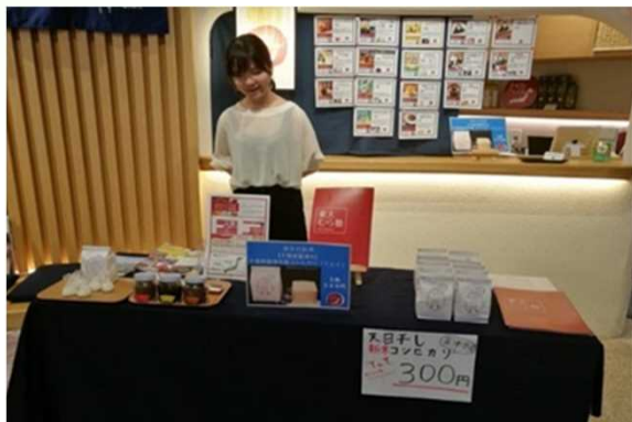
ふるさと納税イベントにて「てとて」をPR、販売