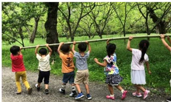
竹を自ら切り倒して竹工作の材料とする体験