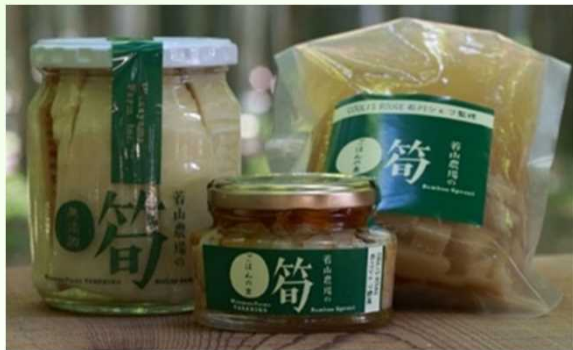
タケノコや栗の6次化製品を販売