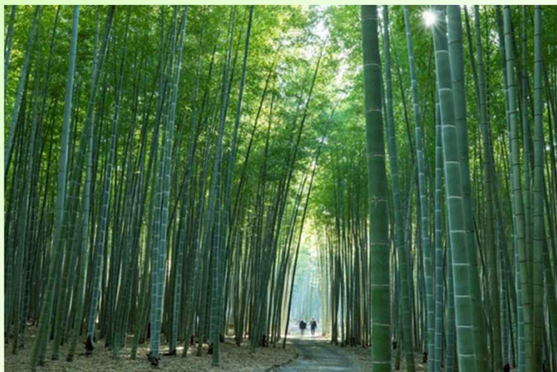
24haもの敷地に広がる圧巻の竹林