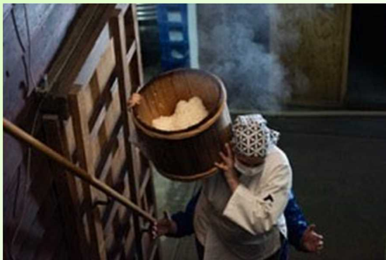
蔵人として本格的な酒造りを体験する参加者