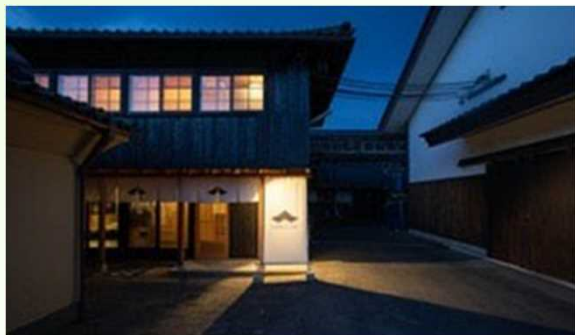
築100年の蔵人の宿舎を宿泊施設にリフォームした「酒蔵ホテル」