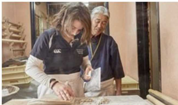
周辺飲食店で実施している着地型旅行商品