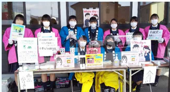
部員による「ホワイトデーギフト米」の販売