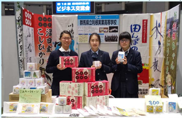
銀行主催のビジネス交流会でPR・販売