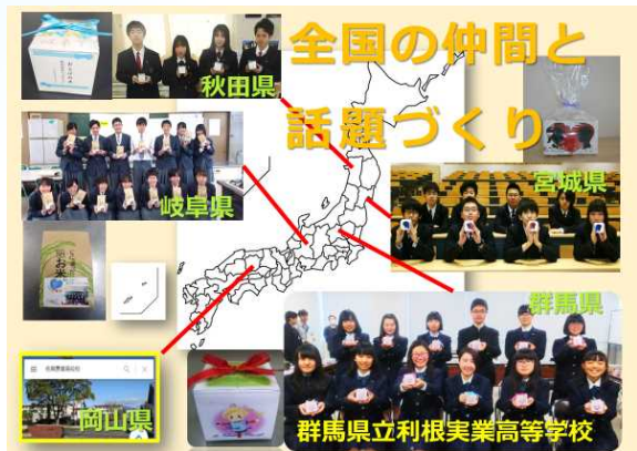
全国の仲間と連携してキャンペーン