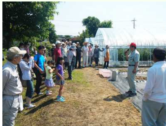
グリーンツーリズム農業体験