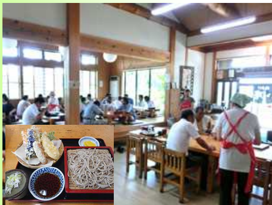
そすい庵の様子と天もりそば