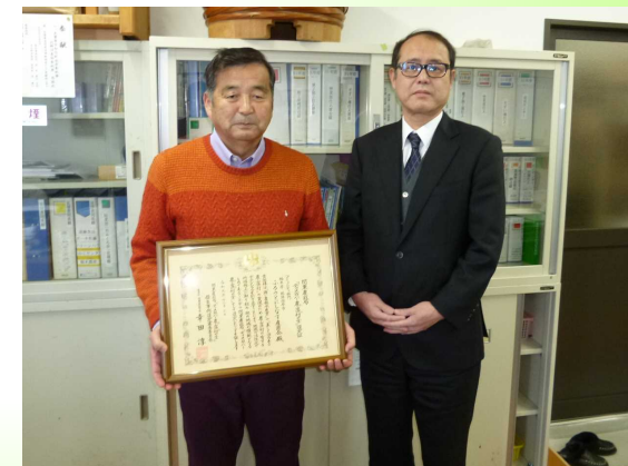
ふるさとにшинаす産直会 会長と 栃木県拠点 地方参事官