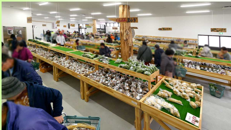
直売センター賑わいの様子