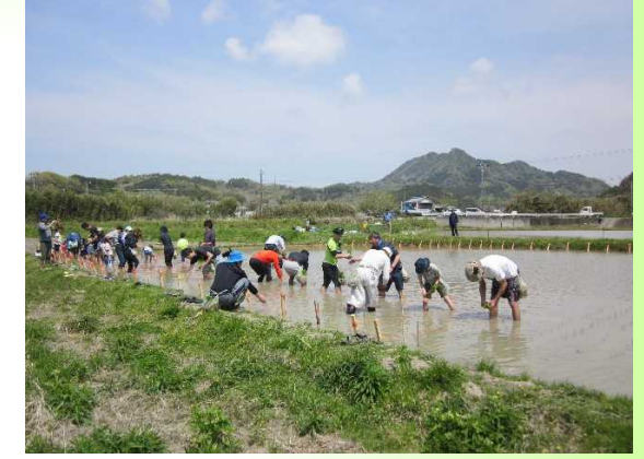
都市部企業の米作り支援