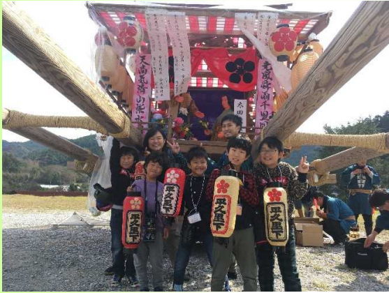
里山・里海体験キャンプ