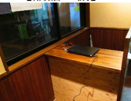
【各種体験受付窓口】