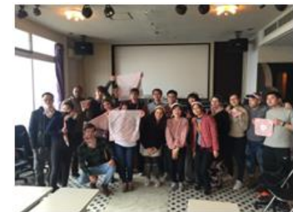
【外国人モニターツアー実施】