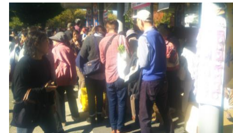
首都圏版地域協働農産市への出店PR