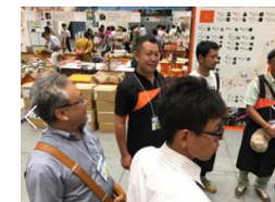
都市部飲食店との コラボレーション