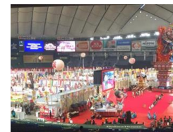
ふるさと祭りに出展