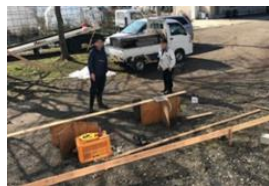
間伐材を利用した ウッドデッキ作り