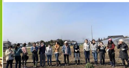
モニターツアー実施