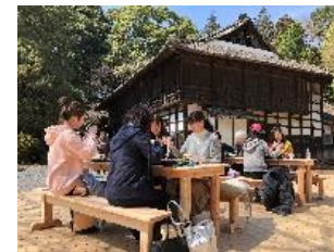
農泊プログラムの開発