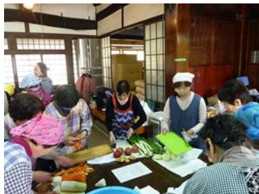
地元野菜を使ったキムチ作り