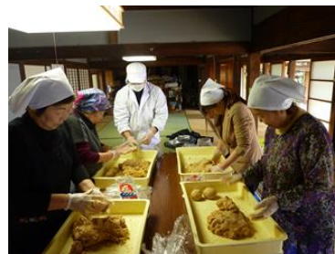
食農体験ツーリズム(みそ造り)