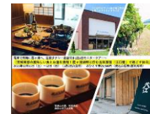
SNSを活用したプロモーション