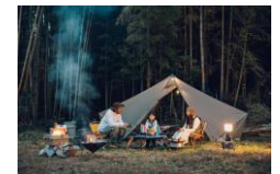
江口屋の裏庭でのアウトドア体験 宿泊、体験、食事をセットにしたプラン