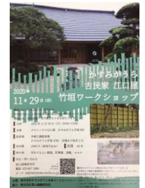
ワークショップの開催