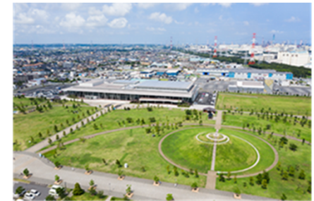
神栖防災アリーナ全景