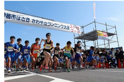
神栖市ランニング大会