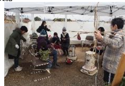
【体験交流イベント実施】