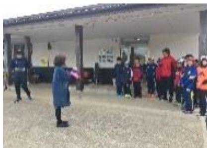
【農泊体験モニター実施】