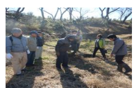
【農業体験の実施研修】