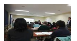
【イスラム圏からの受入に係るハラル研修会】