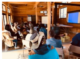
【体験型農業講習会】