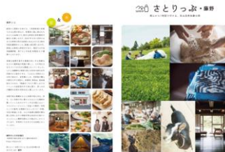
【情報発信リーフレット】