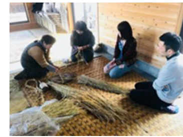
【竹カゴ作り、縄ない体験ツアー】