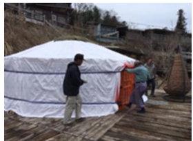
【グランピング体験】