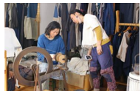
【オーガニックウール系紡ぎ体験】