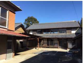
施設整備事業実施対象施設