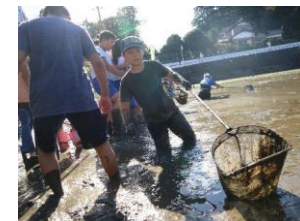
伝統農法を活かした体験ツアーの様子