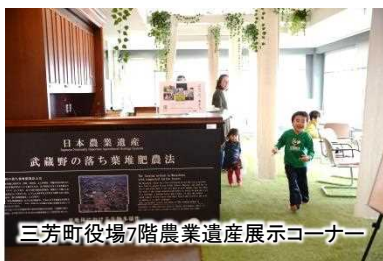
三芳町役場7階農業遺産展示コーナー