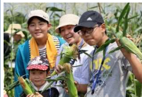
みよし野菜大収穫祭! 畑を遊びつくそう! (R1.7.31)