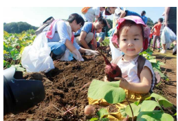
世界一のいも掘りまつり