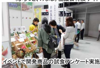
イベントで開発商品の試食アンケート実施