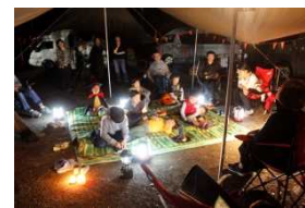
三芳町のミロクいっぱい ハロウィンパーティー (R1.10.26-27)