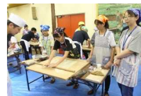
そば職人に教わる! そば打ち体験&みよし野菜堪能 (R1.8..7)