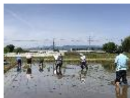
市民団体による手作業の田植え