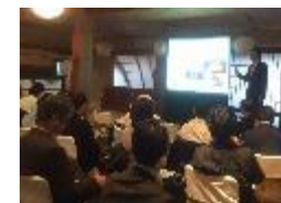
インバウンド受入の勉強会