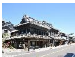
重要伝統的建造物群保存地区に指定されている、中心市街地の蔵造りの街並み