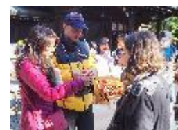
川越を訪れる外国人へのガイド