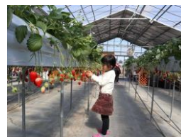
いちご園でのイチゴ狩り