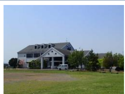
グリーンツーリズムの拠点施設として、改修を予定している農業ふれあいセンター