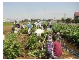
農業ふれあいセンターで実施した野菜の収穫体験