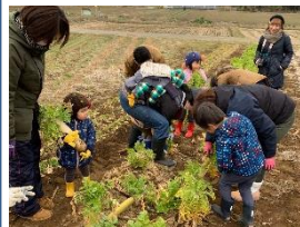
有機農家の畑での 収穫・調理体験