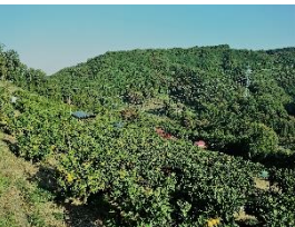
かつて日本最北の生産地 だった風布みかん山