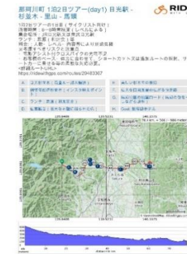
体験プログラムの造成