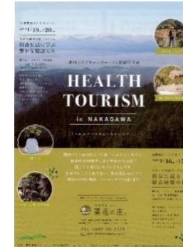
体験プログラムの造成