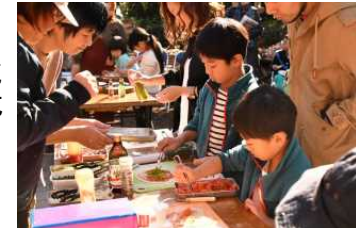
農泊体験コンテンツ(案) 【上】地域野菜を使ったピザづくり体験 【下】地域の山菜を使った天ぷら体験