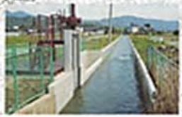
勤左衛門堰排水路