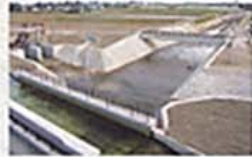
拾ヶ堰・あづみ野排水路合流工