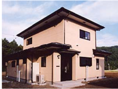
芦沼北菜園付き長期滞在施設

このほか、日方区域及び一倉田和区域において、数軒の陶芸家が移住し、「長野市大岡特産センター」及び「信州新町地場産業振興市場」にて製品の展示販売を行っている。