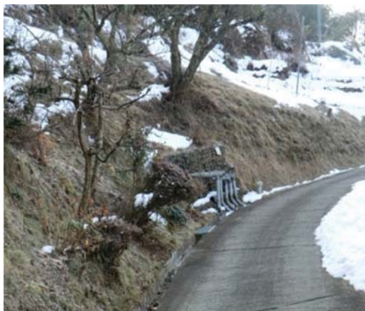
水抜きボーリング、排水路（中原区域）