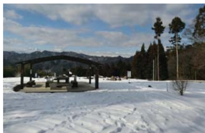
上の平展望台

なお、「上の平展望台」は北アルプスの眺望が望まれる展望スポットとして、塩本区域伊切地区の農家が設置したもので、初夏にジャーマンアイリスやカラー等を植栽し来訪者の目を楽しませているほか、風景写真や星空観察のスポットとしても知られる一方、周辺の竹林をタケノコ狩りに無料開放しており、年間2,000人が訪れている。