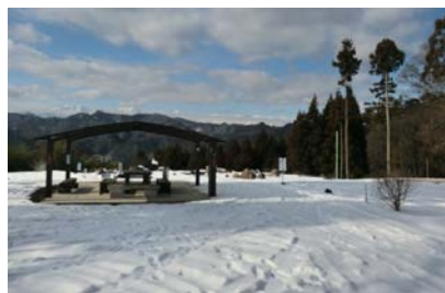
上の平展望台

なお、「上の平展望台」は北アルプスの眺望が望まれる展望スポットとして、塩本区域伊切地区の農家が設置したもので、初夏にジャーマンアイリスやカラー等を植栽し来訪者の目を楽しませているほか、風景写真や星空観察のスポットとしても知られる一方、周辺の竹林をタケノコ狩りに無料開放しており、年間2,000人が訪れている。