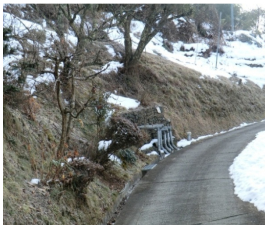
水抜きボーリング、排水路（中原区域）