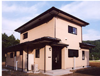
芦沼北菜園付き長期滞在施設

このほか、日方区域及び一倉田和区域において、数戸の陶芸家が移住し、「長野市大岡特産センター」及び「信州新町地場産業振興市場」にて製品の展示販売を行っている。