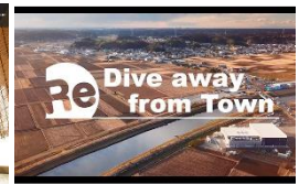
古民家農泊Reと多古町の魅力を伝えるオリジナルPR映像