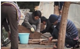
DIYワークショップ風景