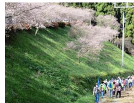
桜山トレイルラン