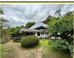
地域の活動拠点となる「一乃望」