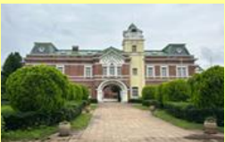
牛久ワイン発祥の施設「牛久シャトー」