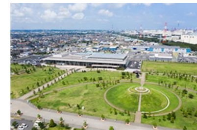
神栖防災アリーナ全景