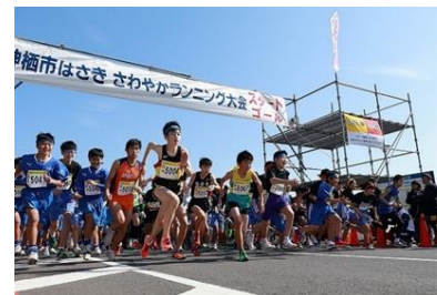
神栖市ランニング大会