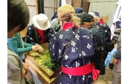
茶もみ体験 一茶摘み体験とセットで実施(令和6年度実施)