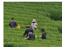
茶摘み体験 (令6年度実施)