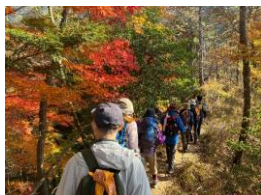
日帰りアウトドア体験