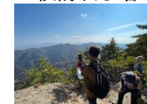
トレッキングツアー