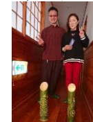
竹灯籠づくり ワークショップ