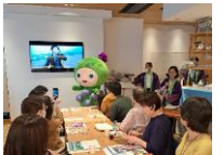
銀座NAGANOでの プロモーション活動