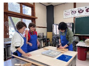
そば打ち体験の様子

○ 農泊受け入れ講習会 農泊を実施したことがなかったため、商工連携サポートセンターの米田講師を招き、関係者に向けて農泊の先進地等の事例についての講習会を実施