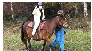
木曾馬乗馬体験の様子