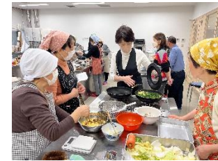
デイリー薬膳講座の様子

○ 農泊体験モニターツアーの造成、実施 (2泊3日、3回) 開田高原産のそば粉を使用した、そば打ち体験を実施し、参加者で味わう等 ・国内向けツアー1回開催 3名参加 ・国外向けツアー2回開催 6名参加 (台湾の方が各回3名参加)