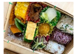
地元の食材を使った健康弁当 (健康プログラムで提供)