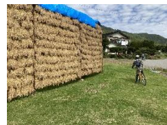
開田高原サイクリングの様子