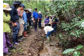
生物多様性プログラム