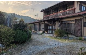
古民家スペース「美波」