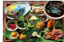
地域の薬草など食材を活用したメニュー開発