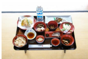
宿泊できる神社「古峯神社」の食事