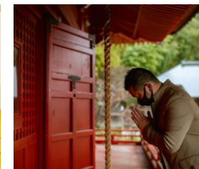
メディアによる情報発信