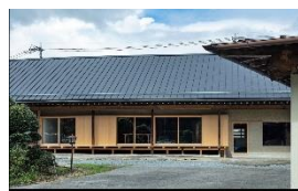
改修した古民家「石原邸」