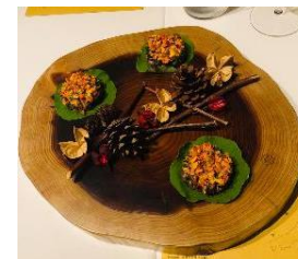
食コンテンツの開発