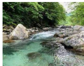
抜群の透明度を誇る大芦川