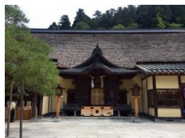
天狗の宿「古峯神社」