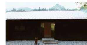
施設改修イメージ