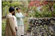
地域住民によるガイド