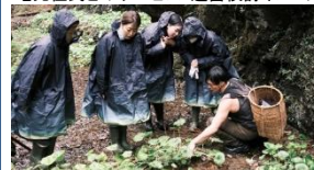
体験プログラム構築イメージ