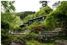
古民家を改修した施設「Satologue」