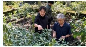
地元住民とのサービス・運営検討イメージ