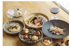
沿線ガストロノミー