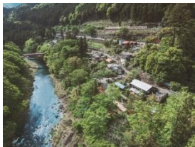
沿線まるごとホテル(奥多摩の集落)