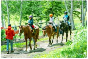
日本有数の乗馬の町