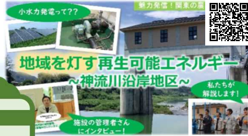
地域を灯す再生可能エネルギー ～神流川沿岸地区～