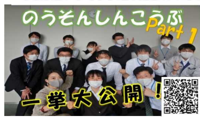
関東農政局で農業農村整備 に携わる魅力5つ!