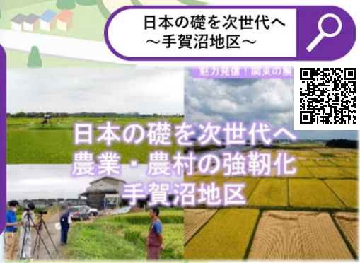
日本の礎を次世代へ ～手賀沼地区～