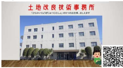
土地改良技術事務所 5つのお仕事教えます