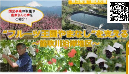
“フルーツ王国やまなし”を支える ～笛吹川沿岸地区～