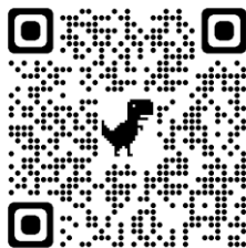
朝ごはん食べよう♪