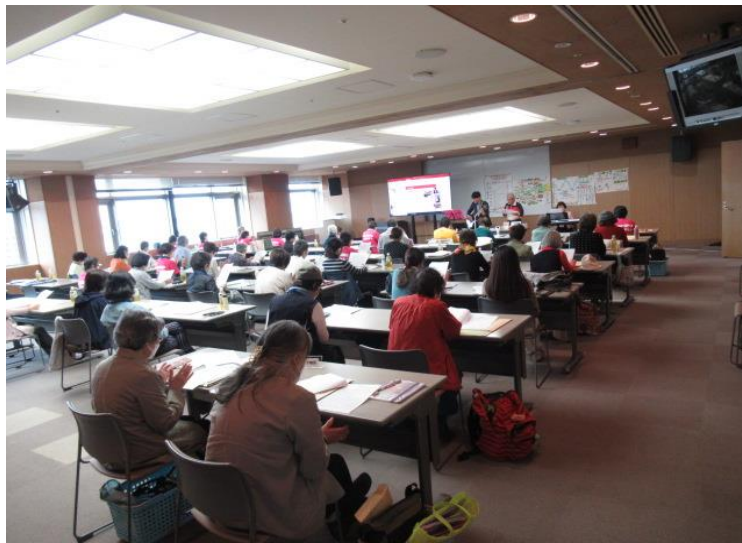
会場風景 写真 2