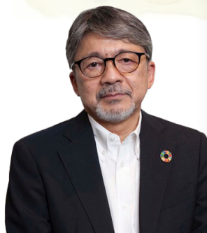
『日本酪農産業史』 著者