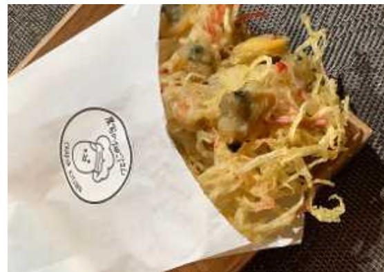
サクサクだいこん天ぷら（試作品）