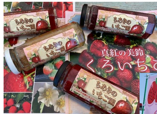
いちごジャム(高濃度タイプ)試作品