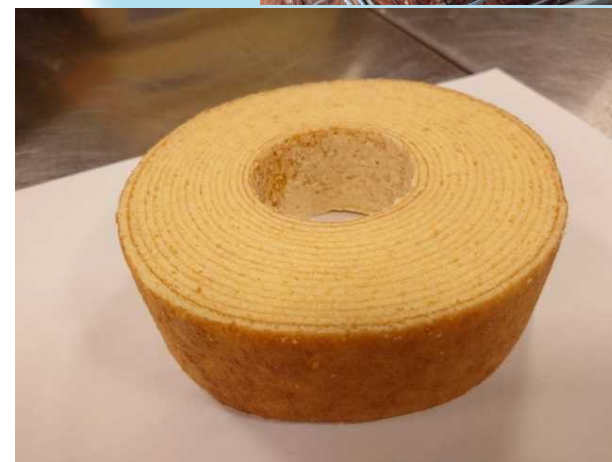
新商品 （米粉）バウムクーヘン