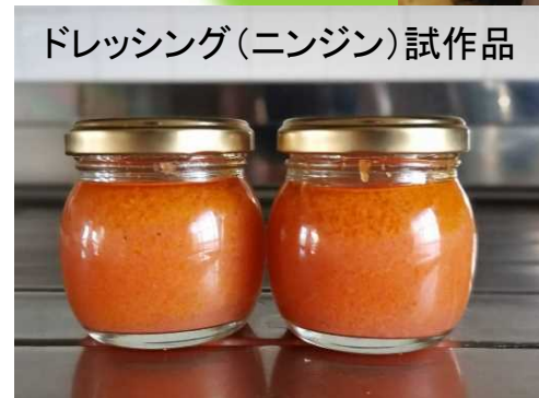
ドレッシング(ニンジン)試作品