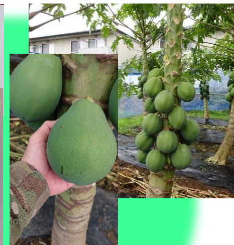
グリーンパパイア (ハワイオウロ)