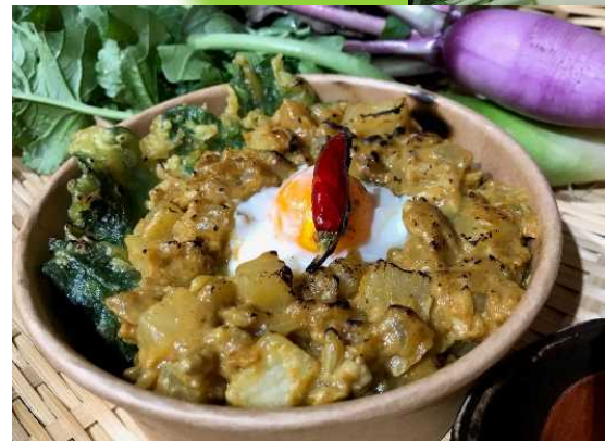
大根カリカリドライカレー（試作品）