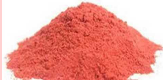
いちご フリーズドライ 粉末