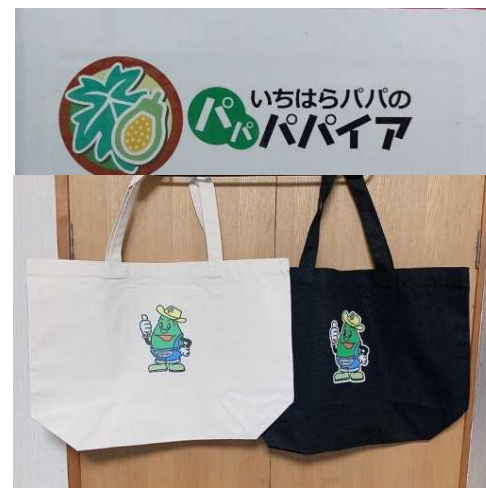
グリーンパパイアロゴ & オリジナルバッグ