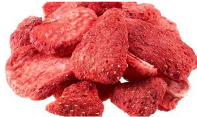
いちご フリーズドライ