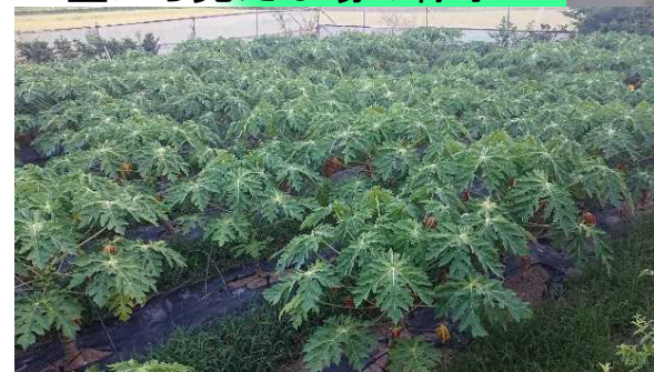
上空から見たほ場の様子