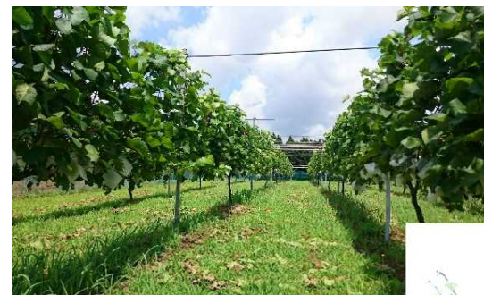
ぶどう圃場の様子