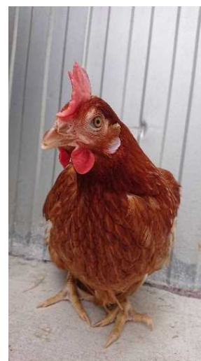
ボリスブラウン種 （赤玉鶏卵）

販売は、飼料等の取引先でもある総合商社への卸売や新設する加工直売施設（自社）、道の駅、スーパー等への販売を通じて、所得の向上・経営の安定化を図る。