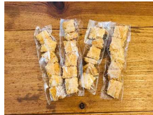
酒粕入り玄米おかき（4種）