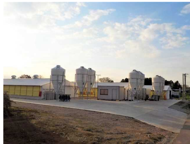
養豚場 (グループ会社)