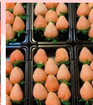
加工に使用する いちごの一例 （左：紅ほっぺ、 右：淡雪）