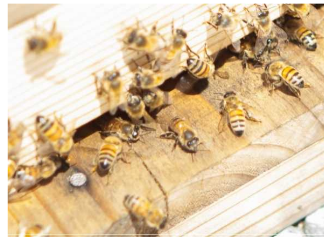
蜜蜂(セイヨウミツバチ)