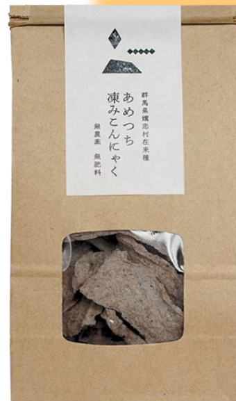
生芋ドライ（凍み）こんにゃく