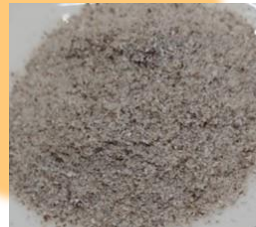
全粒こんにゃく粉（60メッシュ）