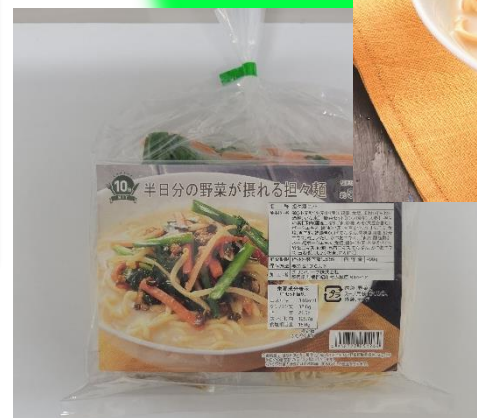
ミールキット（セット内容品2）