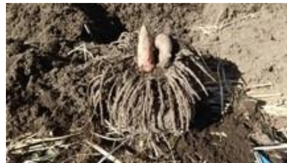
有機こんにゃく芋