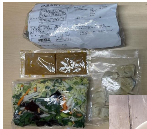
ミールキット（セット内容品1）