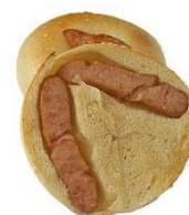
ぐるっとあらびきソーセージ