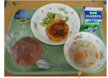
「②クラムチャウダー」