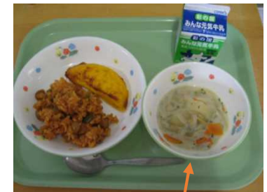
「③白花豆のクリームスープ」