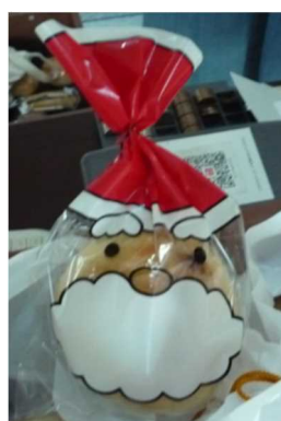
「クリスマスサンタ」

米粉入りベーグル専門店WAベーグル（同連絡会会員）では、埼玉県産米粉と北海道産小麦粉で作ったベーグル、定番商品のほか旬の食材を使用した季節限定品も提供しています。